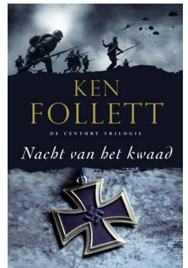
Nacht van het kwaad is het tweede boek in de Century-trilogie