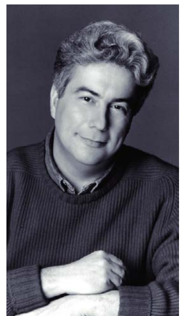
Een gevierd auteur