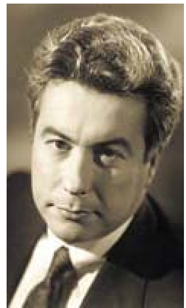
De eerste bestseller

Sneeuwjacht (2005) is een hedendaagse thriller over de diefstal van een dodelijk virus uit een laboratorium. Tegen de achtergrond van een stormachtige witte Kerst in de afgelegen Schotse Hooglanden, barst Sneeuwjacht van jaloezie, wantrouwen, seksuele aantrekkingskracht, wedijver, verborgen verraders en onverwachte helden.