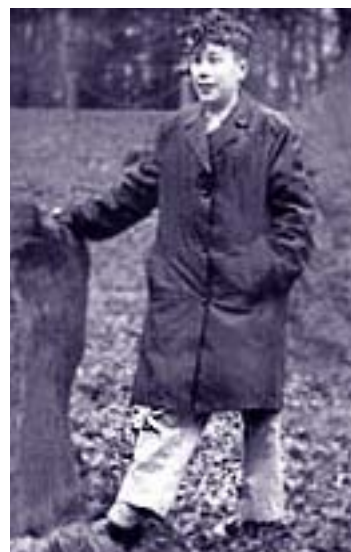
Een schooljongen in Wales