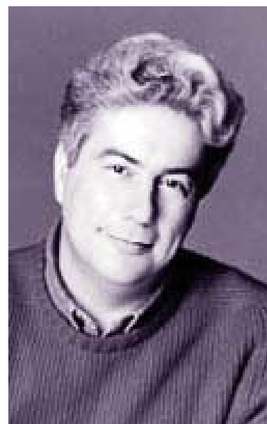
Un écrivain accompli