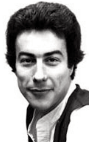
La vie d'étudiant