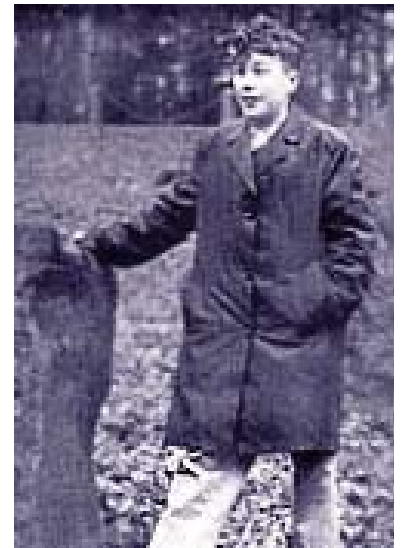
Un écolier au Pays de Galles

Eye of the Needle (L'Arme à l'oeil) propulse Ken au rang d'auteur à succès. Publié en 1978, il remporte le prix Edgar et se vend à plus de dix millions d'exemplaires! Le succès du livre permet à Ken de donner sa démission, de louer une villa dans le Midi et de se consacrer entièrement à la rédaction de son roman suivant: Triple (Triangle) .