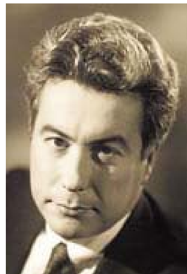
Le premier livre à grand succès

La chute des géants (2010) suit le destin lié de 5 familles – Américaine, Allemande, Russe, Anglaise