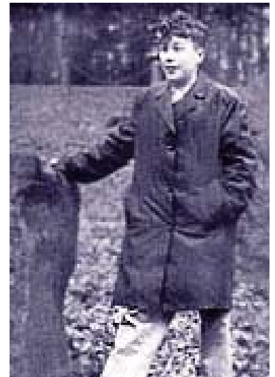
Un écolier au Pays de Galles

Eye of the Needle ( L'Arme à l'oeil ) propulse Ken au rang d'auteur à succès. Publié en 1978, il remporte le prix Edgar et se vend à plus de dix millions d'exemplaires! Le succès du livre permet à Ken de donner sa démission, de louer une villa dans le Midi et de se consacrer entièrement à la rédaction de son roman suivant: Triple ( Triangle ).