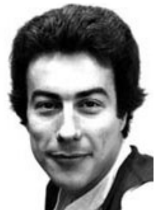
Vida de estudiante...