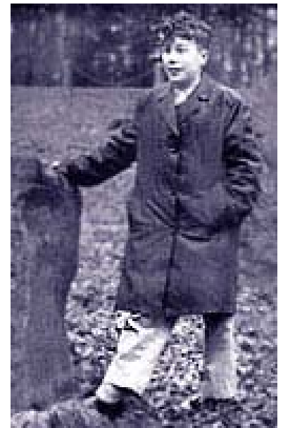
Como escolar en Gales

La isla de las tormentas fue el libro que catapultó la carrera de K en Follett como autor de best sellers. Publicado en 1978, ganó el premio Edgar y ha vendido más de diez millones de ejemplares. El éxito obtenido le permitió dejar su trabajo y alquilar una villa en el sur de Francia para dedicarse a tiempo completo a su siguiente novela: Triple . «Me preocupaba mucho no poder repetir lo que había logrado. Les ocurre a muchos