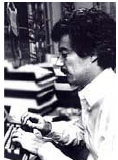
El talento de un escritor