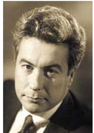
El primer best seller

En 2007 aparecía su novela, Un mundo sin fin , la esperada secuela de Los pilares de la tierra . El autor regresaba a Kingsbridge doscientos años después, y los protagonistas eran los descendientes de algunos de los personajes de aquella novela, cuyos destinos se veían truncados por la Peste Negra, la terrible plaga que asoló Europa a mediados del siglo XIV.